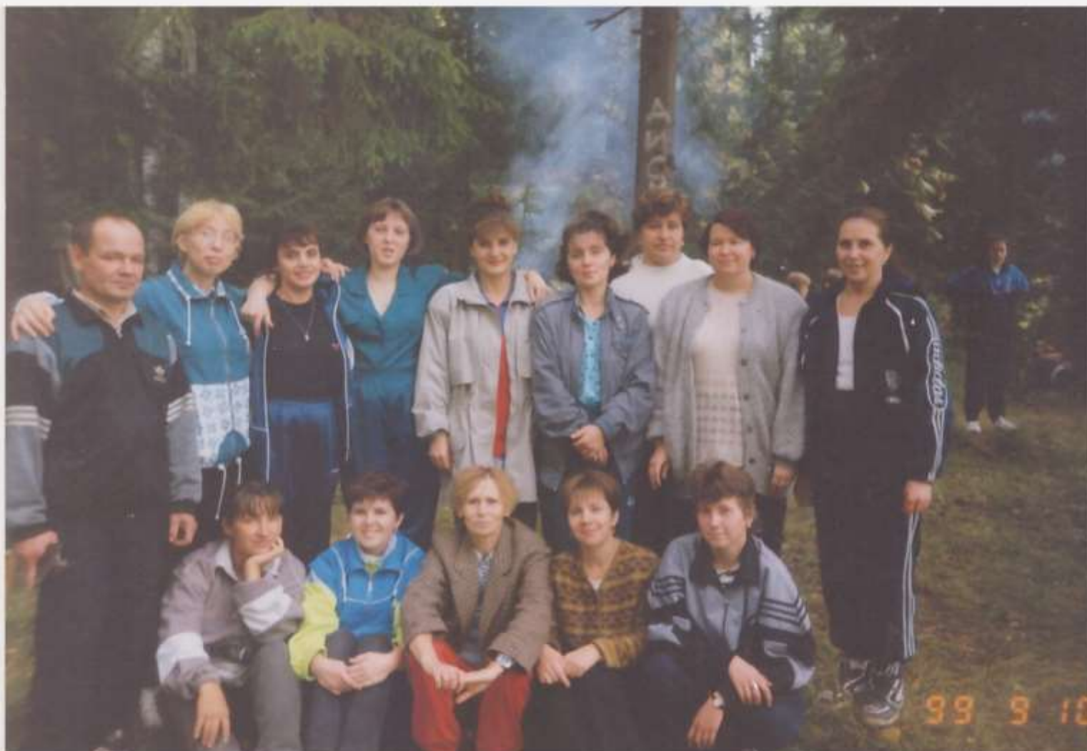
Спортивный праздник педагогов