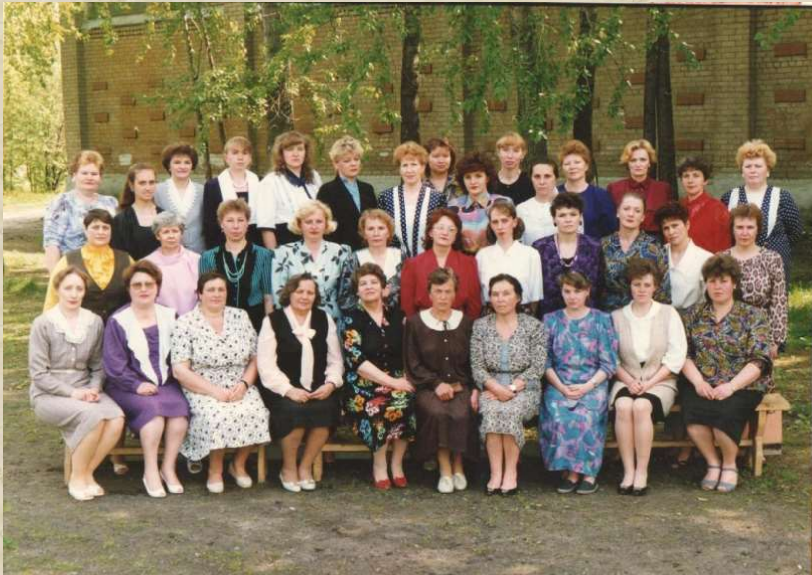
Педагогический коллектив школы №55 г. Перми 1994-1995 учебный год